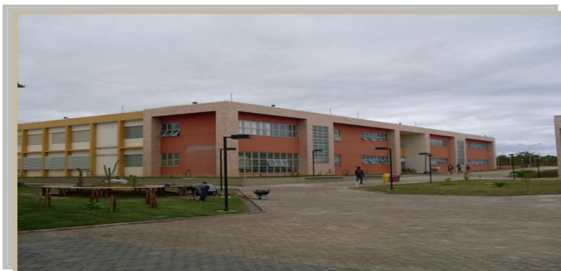
Instituto Multidisciplinar em Saúde Campus Anísio Teixeira (IMS / CAT)

Endereço: Rua Rio de Contas, nº 58, qd. 17, lt. 58, Candeias, Vitória da Conquistas/BA