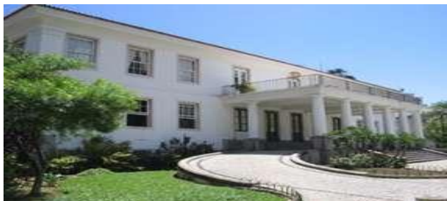
Reitoria da UFBA