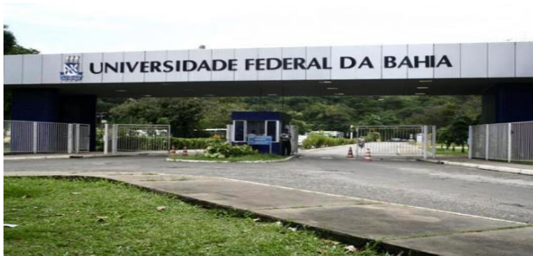
Portaria Principal da UFBA

Endereço: Rua Barão de Jeremoabo, s/n, Ondina, 40170-115, Salvador