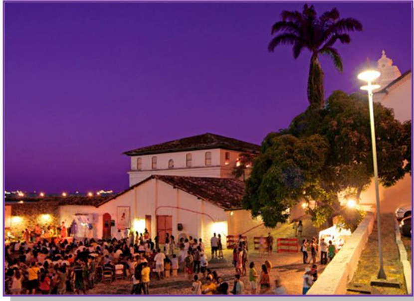
O projeto JAZZMAM acontece todos os sábados a partir das 18h

A cidade de Salvador é conhecida internacionalmente pelo seu forte potencial turístico e por sua efervescência cultural. Além das atividades promovidas pela UFBA, os alunos estrangeiros podem conhecer diversos pontos turísticos da cidade, dos quais listamos sinteticamente apenas os principais: