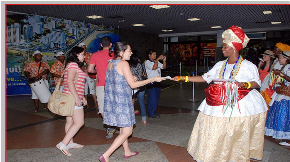
Recepção com baianas no Aeroporto Internacional Luís Eduardo Magalhães

Logo após o desembarque no Aeroporto Internacional Luís Eduardo Magalhães, ao deixar o local, o estudante intercambista é recepcionado pelo belo corredor de bambuzais da área externa. A pista de acesso ao aeroporto é circundada de um espaço verde muito bonito. À noite, o caminho é iluminado com luzes verdes e brancas.