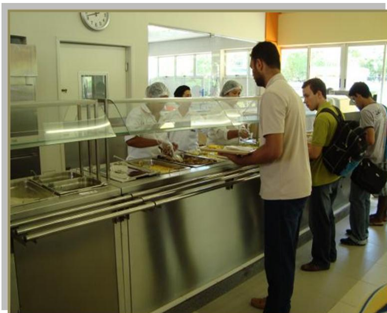
Estudantes almoçam no R.U da UFBA